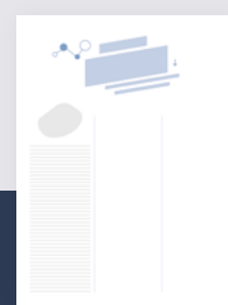
Med-Info 750 €

Hierbei stehen Ihnen unsere gesamte Kompetenz in Sachen Fachredaktion, Grafik, Online, Vertrieb und Distribution zur Verfügung. Damit Ihr Projekt perfekt, schnell und kostengünstig zum Erfolg wird!