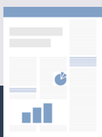
Sonderpublikation 3.600 €