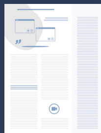
Medizinprodukt im Fokus