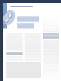
Studie im Fokus