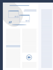
Medizinprodukt im Fokus